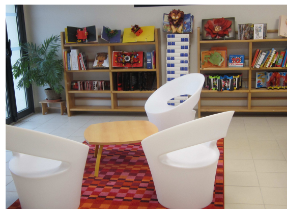
Bibliothèque de Saint-Antoine de Ficalba

Dans une bibliothèque, on peut se documenter, lire sur place, raconter des histoires à des enfants... La position de lecture sera différente suivant notamment l'âge des lecteurs : une personne âgée préférera lire assise, un enfant pourra lire allongé sur le sol... Malgré l'exiguïté de l'espace d'une petite bibliothèque, il est important de concilier ces différentes exigences. Proposez une table –plutôt ronde pour la convivialité- et des places assises. Pour les jeunes enfants, prévoyez une moquette ou tapis munis d'accessoires ludiques : coussins moelleux, petits bacs à cachettes... Quelques chauffeuses, voire même un canapé, un bac où ranger quelques BD, la proximité du rayonnage périodiques avec un éclairage d'ambiance suffisent à créer un espace convivial pour la lecture de loisir.