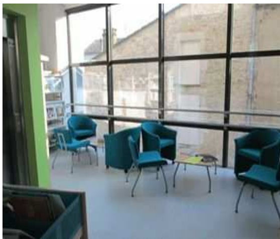
Bibliothèque de Cancon

L'éclairage (lumière naturelle et d'ambiance) conditionne fortement le bien-être des usagers. A l'inverse, il est souvent néfaste aux documents qui doivent être protégés par des stores, rideaux, pare-soleil... Les locaux doivent être bien ventilés et à température constante toute l'année.