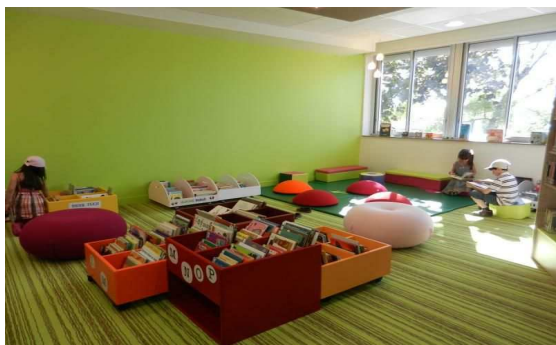
Bibliothèque de Foulayronnes

On pensera à la future croissance éventuelle du bâtiment qui devra être possible avec un minimum de perturbations sur le fonctionnement.